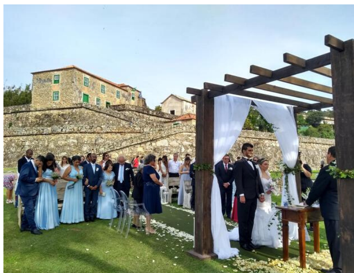
FORTALEZAS DE SANTA CATARINA