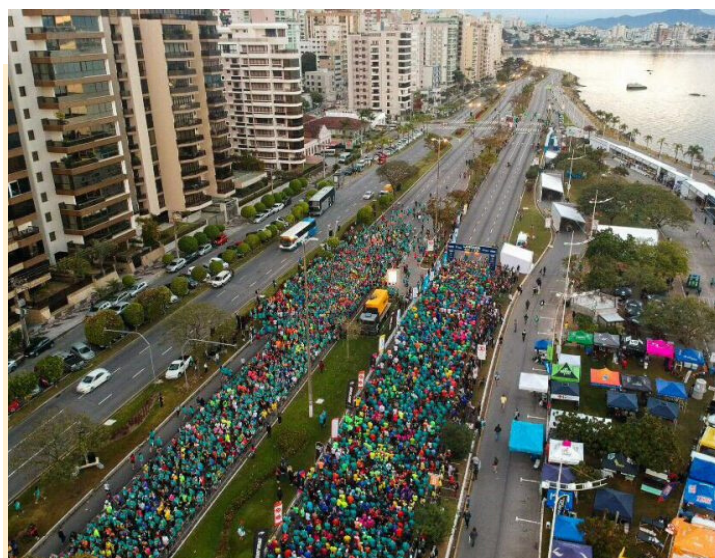
AV. BEIRA MAR NORTE