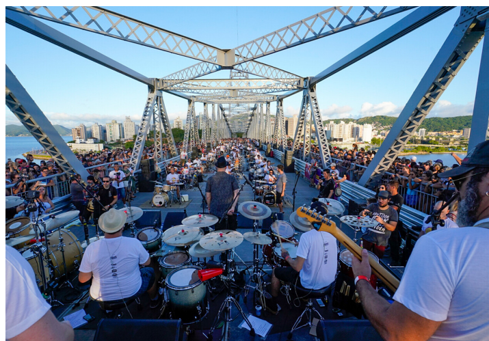
PONTE HERCÍLIO LUZ