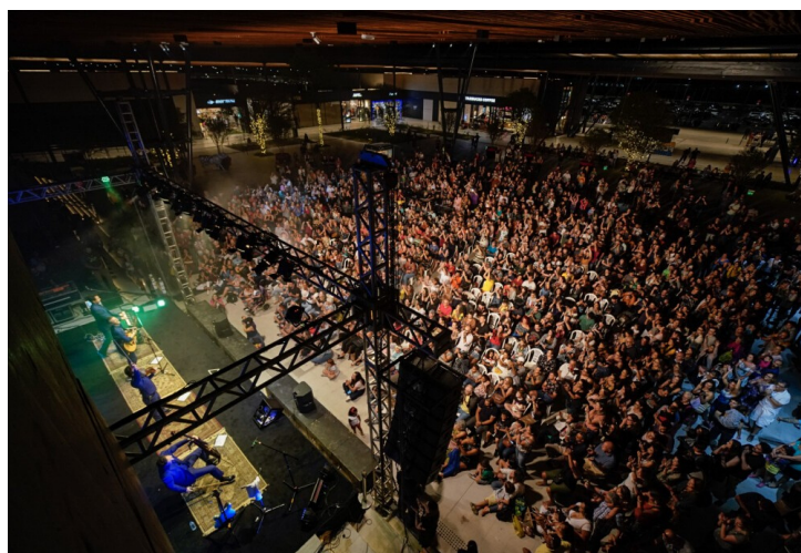
BOULEVARD 14/32: FLORIPA AIRPORT

Desafie-se a oferecer o novo aos seus clientes. Florianópolis oferece diversas opções de cenários especiais para realização de eventos que entreguem experiências. Para ter acesso aos editais e protocolos de autorização, necessários para realização de eventos em áreas públicas e patrimônios, consulte o Floripa Convention.